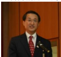
鳥取県 平井伸治知事

このフォーラムは「聴覚障害者と聴こえる住民が互いを尊重し合い、共生、共存できる地域づくりを推進するため、手話言語を広げ、また手話を使いやすい社会環境を構築する必要がある。このフォーラムは、これらの実現のためには何が必要なのかを学ぶとともに、多くの人にその必要性を知ってもらうこと」を目的とし、鳥取県の平井伸治知事が「手話言語条例で拓く未来」をテーマに基調講演を行いました。