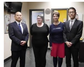
EduKid（乳幼児聴力検査センター）の職員の方と共に