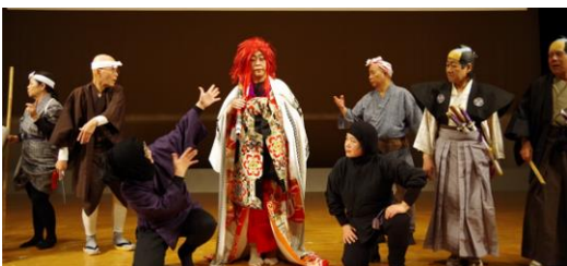
北九州市聴覚障害者協会、北九州手話の会による手話寸劇「おんな五右衛門」

その後、北九州市聴覚障害者協会と北九州手話の会による障害者差別を織り込んだ手話寸劇「おんな五右衛門物語」を披露し、盛況の内に終了しました。