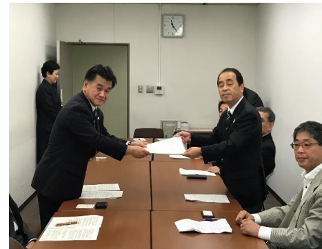
厚生労働省へ要望を提出

災害はいつ起きるかわかりません。暮らしの問題、健康問題等ありますが、とりわけ情報アクセスや情報保障について、地域格差が発生しないような取組みを促していきます。