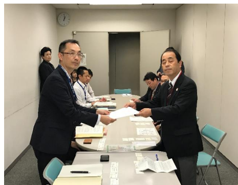
総務省に要望を提出

厚生労働省からは、「在宅訪問の派遣は、災害救助法の対象外になっている。今の制度では、カバー出来ないが、現地（熊本）の要望を出るだけ聞きたい。相談員については情報提供施設の事業として相談員を配置しているので活用を考えたい。」等の話がありました。