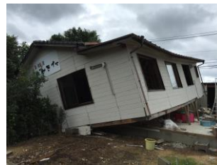
＜西原村（被災ろう者宅）＞