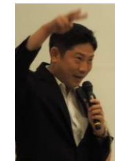
室蘭市の青山剛市長、